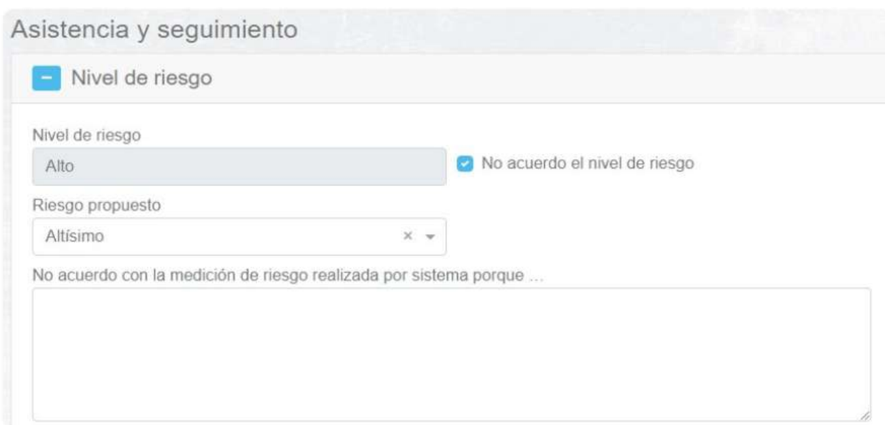
Fig. 3 Procedimiento para informar desacuerdo con la medición de riesgo por sistema. Ejemplo a partir del Módulo Federal.

Luego del registro de las circunstancias relatadas por la persona en situación de violencia, puede ocurrir que quien realizó la carga del caso no acuerde con la medición arrojada por el cálculo automático. Ante esto, podrá clickear un check que habilita un campo abierto de texto donde podrá explicar cuáles son los elementos del caso que el sistema no está contemplando (tanto si el cálculo es menor o mayor al esperado luego de la escucha del caso). También podrá seleccionar, a través de un campo desplegable, cuál es el nivel de riesgo que considera correcto.