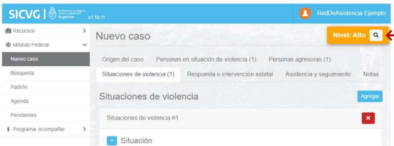
Fig. 1 Visualización de la medición de riesgo en el sistema. Ejemplo a partir del Módulo Federal del SICVG.

En caso de encontrarse habilitado en el módulo del cual se ingrese, el nivel de riesgo se muestra en un semáforo en la esquina superior derecha.