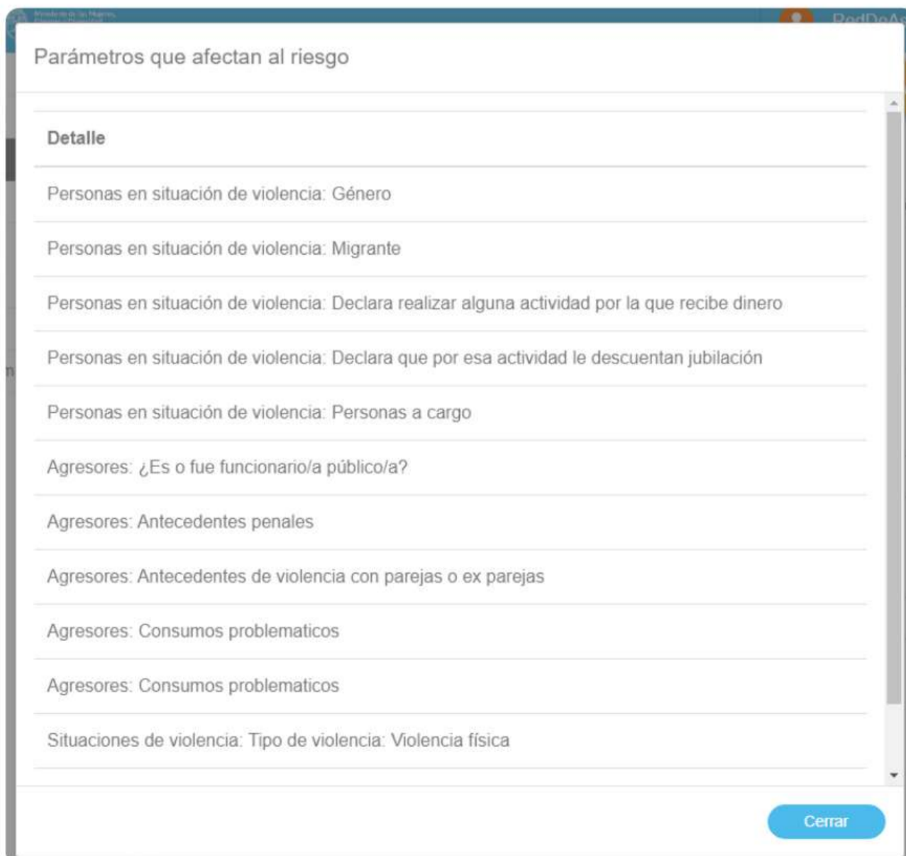
Fig. 2 Parámetros considerados para la medición de riesgo. Ejemplo a partir del Módulo Federal del SICVG.

Los parámetros que el sistema está considerando para la medición pueden consultarse a partir de la lupita que se encuentra señalada en rojo en la Figura 1.